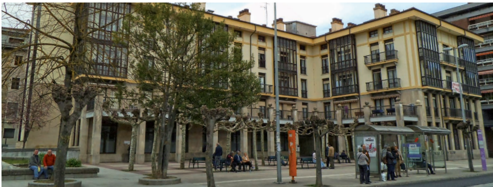
Iturbide egoitza / Residencia Iturbide

■ RESIDENCIA DE ANCIANOS ITURBIDE Garibaldi kalea 1 ..... 943 252 090