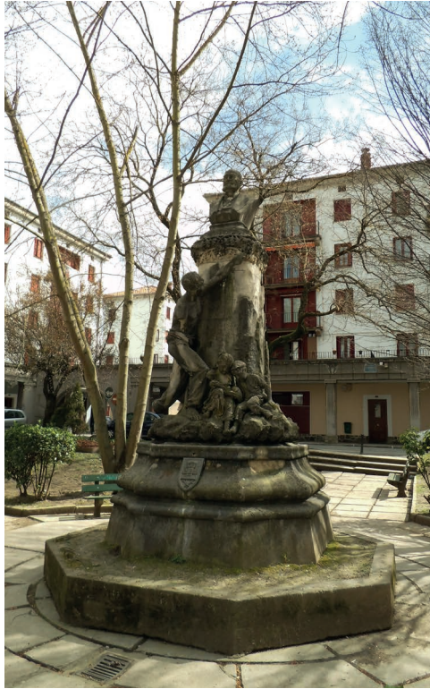
Monumento a Pedro Viteri

datua, Elma lantegia eta dorrea eta "Etxe txikiak" izenez ezagutzen den urbanizazioa.