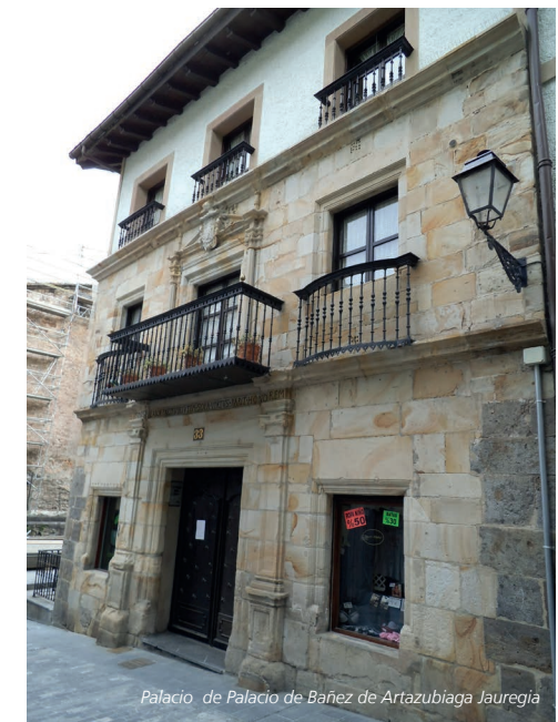
Palacio de Bañe de Artazubiaga Jauregia

La primera noticia sobre la Parroquia de San Juan Bautista data del año 1355. El edificio pertenece al estilo gótico, pero el remate del campanario es clásico, del renacimiento. Tiene planta de cruz latina, tres naves y un ábside. Desde el exterior resultan evidentes las características de la arquitectura gótica. Posee tres puertas que presentan escasa decoración y a través de arquivoltas consiguen un aspecto abocinado. La principal se ubica en el pórtico del campanario. En el tejado se pueden observar unas gárgolas en formas de animales: jabalí, mono, lobo... En el interior, sin embargo, se pueden observar las tres naves, siendo la nave central más alta y ancha que las laterales. Dentro de los elementos de la iglesia, los retablos son los de mayor trascendencia. La parroquia presenta dos retablos de San Juan: Uno pertenece al renacimiento y el otro al barroco. Podemos observar vidrieras y también el coro, de inspiración gótica. Tras la reforma llevada a cabo en la década de 1990, la apariencia del templo cambió por completo, tanto en el exterior como en el interior.