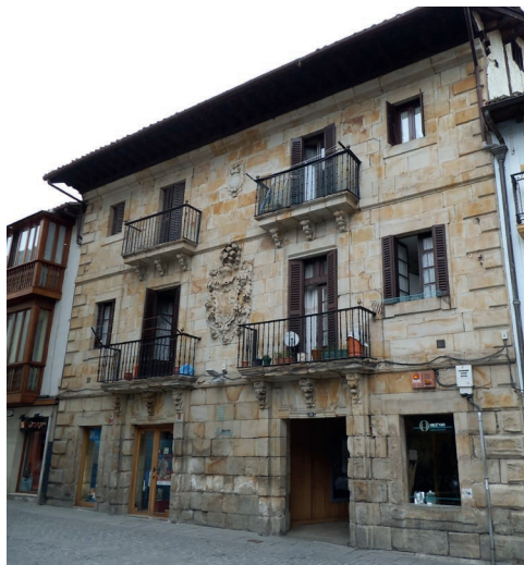
Palacio Okendo Jauregia