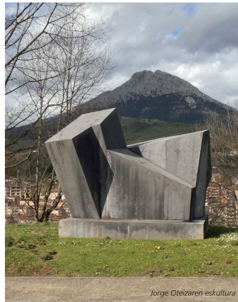
Jorge Oteizaren eskultura

Por último, destacaremos en el barrio de Uribarri, la iglesia de Nuestra Señora de la Esperanza y el caserío Gorostiza, declarado monumento.