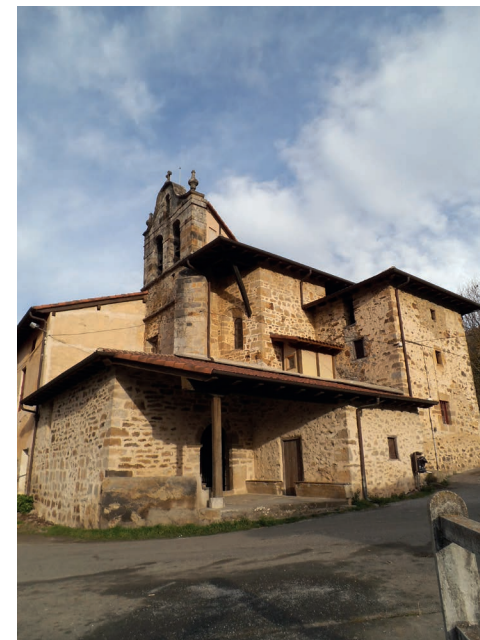
San Esteban parrokia

Badaude kultura interesa duten beste elementu batzuk XX mendeko lehen erdian izandako industria garapenari lotutakoak: Zerrajerako eraikin nagusia, monumentu izen-