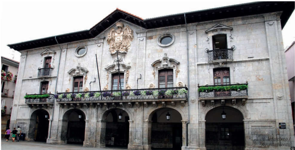
Udalbatza / Ayuntamiento