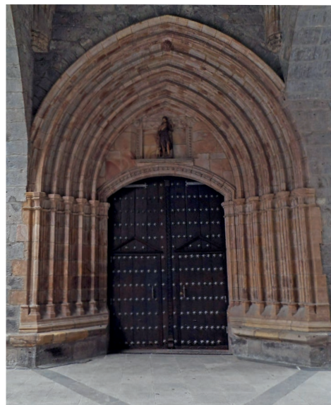
San Joan Bataiatzailearen parrokia / Parroquia de San Juan Bautista

Alde zaharra, Eusko Jaurlaritzak monumentu multzo deklaratu zuen 1997an. Hasiara batean harreres inguratuta zegoen, Goikobalu gazteluaren azpialdean. Gaur egun, hasierako almendra itxurako egitura mantentzen du, baina ez gaztelua ezta harreria ere. Hiru kalek osatzen dute alde zaharra: Erdiko kalea, Ferrerías eta Iturriotz. Iraganen bost ate bazeuden ere, egun, hiru ate daude. Portaloia da aterik garrantzitsuen, Maalako errebalaren aurrealdean dago eta bertan batzen dira alde zaharreko hiru kaleak; Zurgin kantoia da zaharrena eta hirugarrena Kanpatorpea.